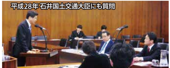
平成28年 石井国土交通大臣にも質問